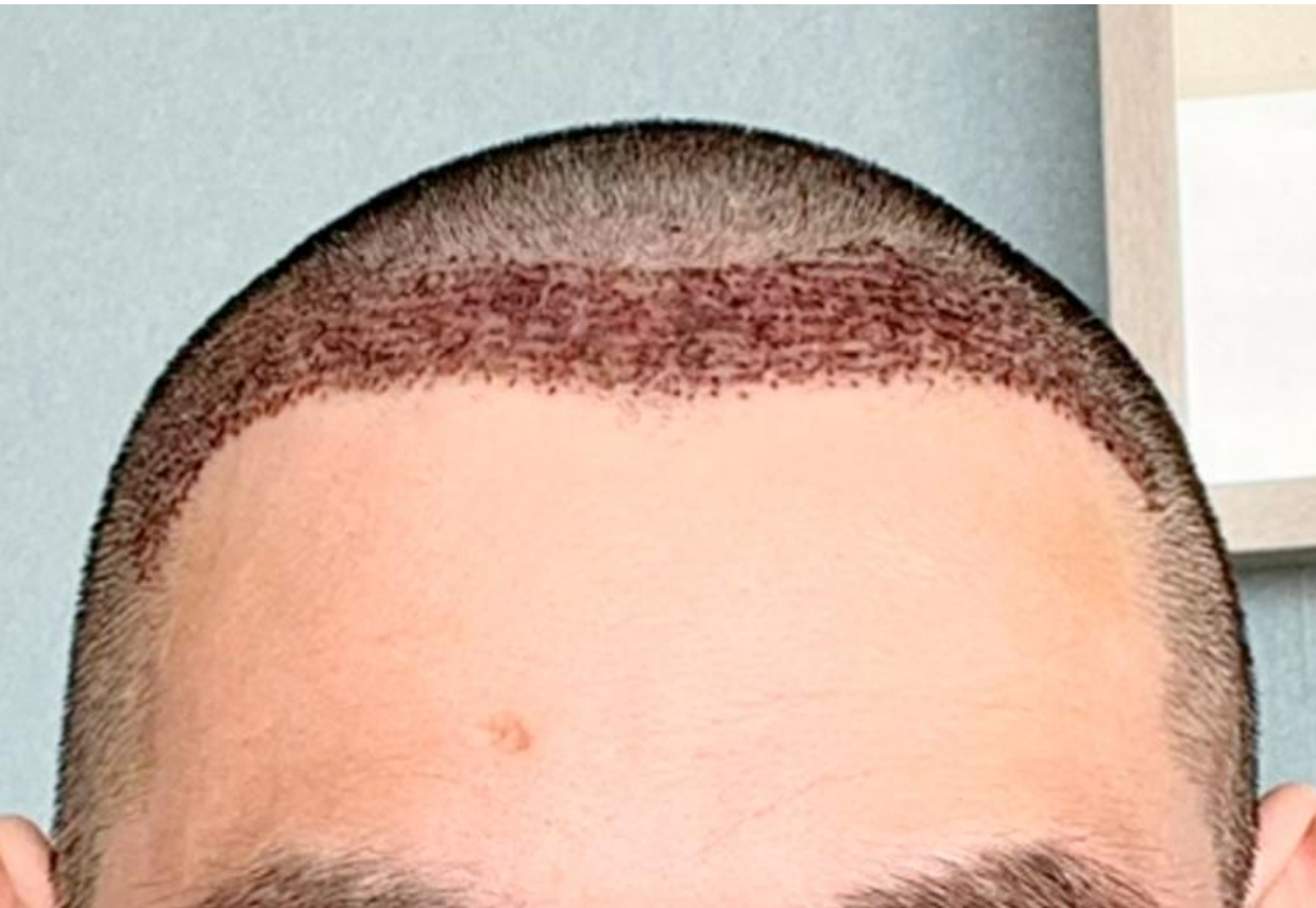
植毛手術から 3日後 の前頭部写真